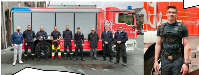
Marvin M...

Rückenstärkung für die Düsseldorfer Feuerwehr